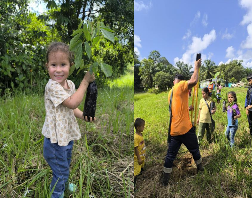
Jornada de siembra programada con la comunidad de la vereda Km 30 y los aliados estratégicos que integran el proyecto de infraestructura en desarrollo.